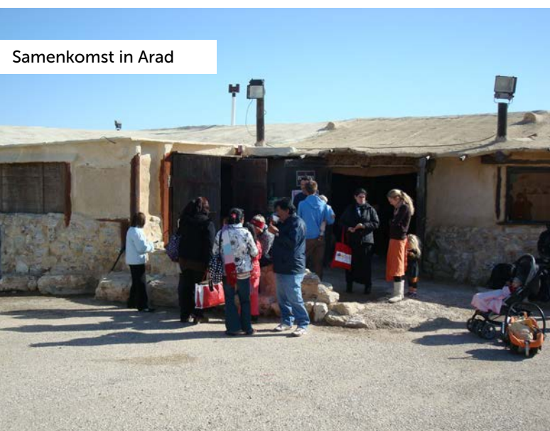
Samenkomst in Arad

Om de Stichting Steun Messiasbelijdende Joden in uw testament of wilsbeschikking op te nemen, dient u de volgende zin op te nemen: Ik legateer vrij van rechten aan Stichting Steun Messiasbelijdende Joden te Nijkerk een bedrag van € ..... om te worden afgegeven drie maanden na mijn overlijden.